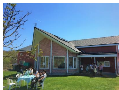
岩瀬牧場直営ジェラートショップ

北海道砂川市の広大な大地で、のびのびと育った乳牛200頭から搾った新鮮なミルクを使用し、プリンやチーズケーキ、ジェラートなどのスイーツを製造・販売しています。2012年には「ご当地アイスグランプリ」で全国42社・64アイテムの中から最高金賞を受賞しております。