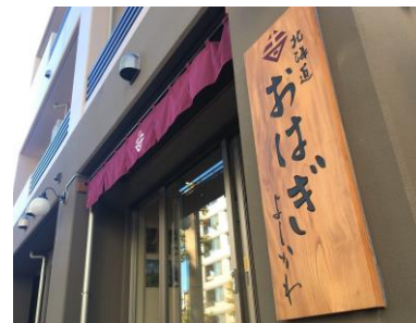
北海道おはぎ よしかわ

「つぶあんおはぎ」、「こしあんおはぎ」、「きなこおはぎ」の三種類のおはぎをご用意しております。また四季折々の素材を使用したおはぎもございます。